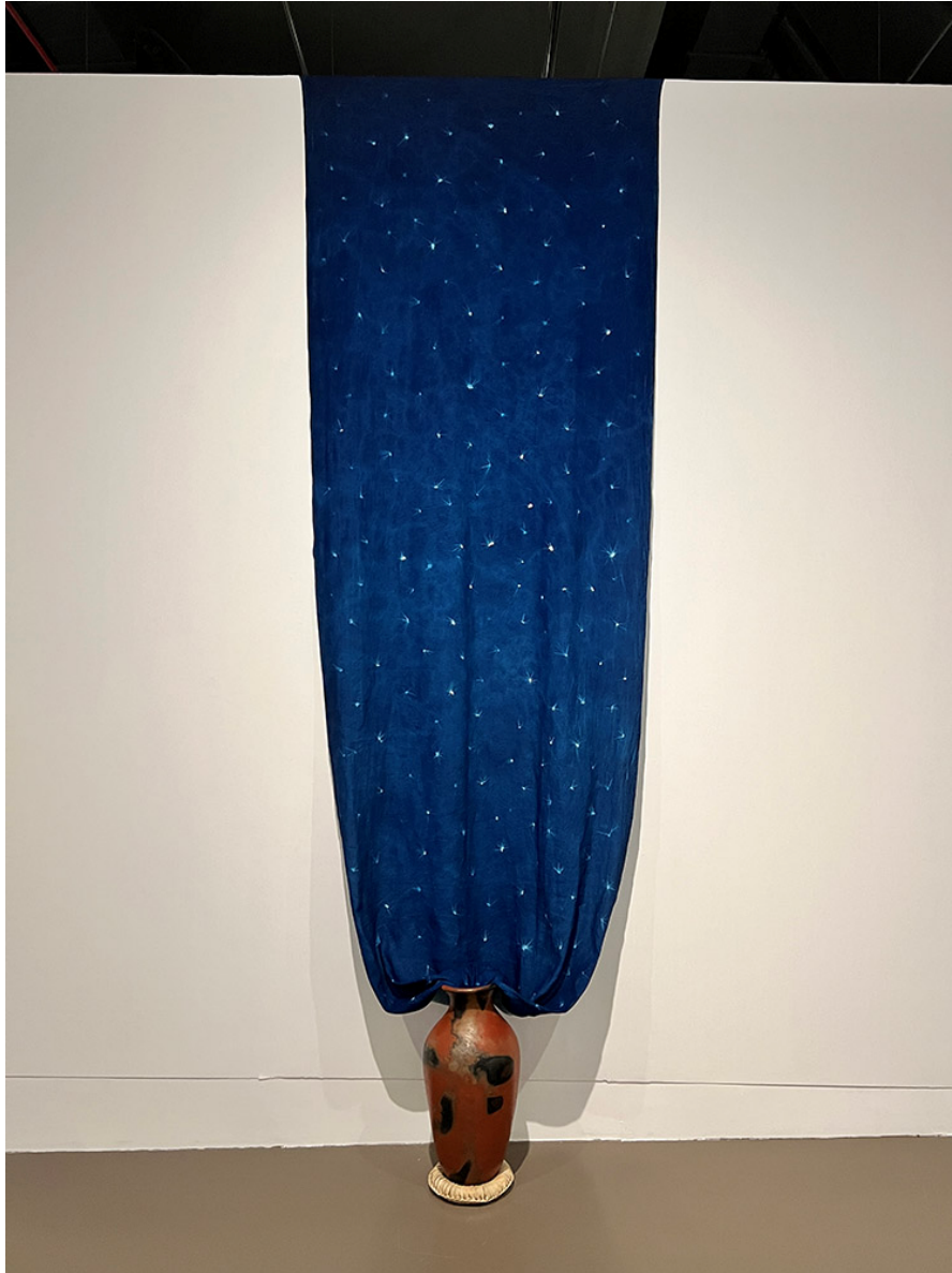
The stellar influence, 2024 Cyanotype sur lin, vase rituel en terre cuite , 400 x 125 cm Unique, version 1/3

Dans l'installation The stellar influence un manteau fait d'un immense cyanotype parsemé d'étoiles émerge d'un vase traditionnel en céramique, semblable aux urnes funéraires des premiers habitants de Mexico. Les étoiles qui parsèment le manteau proviennent de l'empreinte d'épines de cactus nopal, cactus très présent sur la colline Tepeyac. Rosano Gamboa utilise ici des éléments terrestres pour représenter le ciel nocturne « as above so below ».