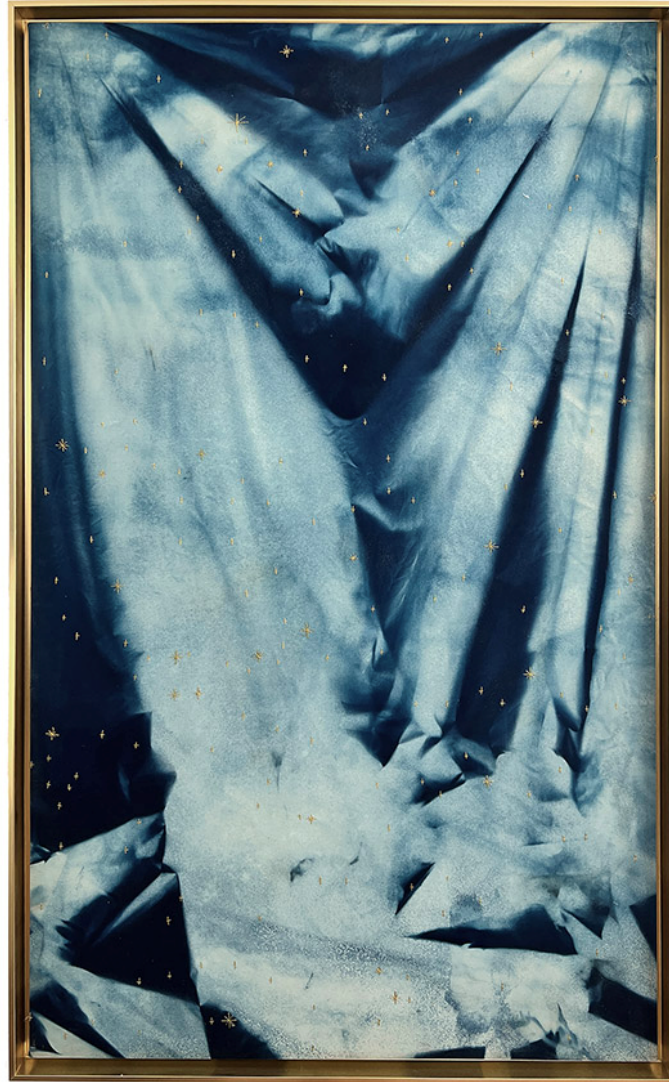
Are you not under my shade and shelter ? 2022 (no estas tu bajo mi sombra y resguardo ?) cyanotype sur lin, broderies, 170x100 cm

La phrase qui donne le titre à l'œuvre Are you not under my shade and shelter? est une des dernières énoncées à Juan San Diego par la Vierge de Guadalupe lors de son apparition. Une pièce de lin à la taille de l'image sacrée conservée à Mexico a servi pour un cyanotype obtenu en présentant le tissu au soleil dans la position exacte où s'est révélée l'image de la Vierge. Les étoiles sont aussi brodées dans la position exacte du jour où l'image est apparue, ce qui donne une carte de l'univers. L'œuvre s'apparente ainsi à une reconstitution du « miracle » pour créer une nouvelle image.